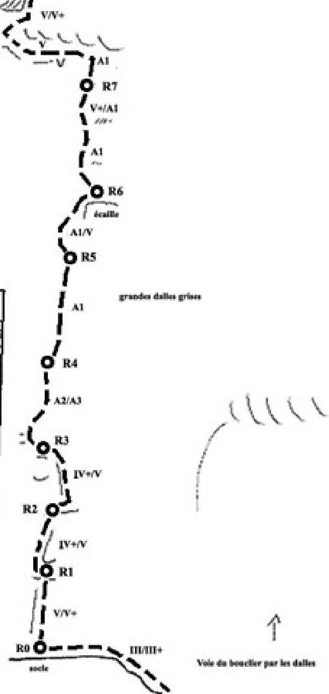
Voie du bouclier par les dalles